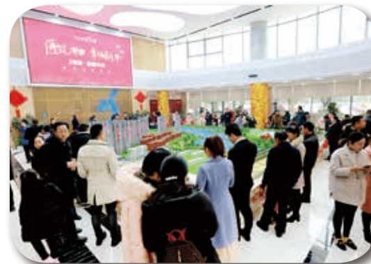
1月27日，农历腊月二十二，湘潭湾田·九华湖壹号【澜湾】2号栋118-143㎡滨湖豪宅新品盛大开盘，受到湘潭市民追捧，也开启了项目新年第一波销售热潮。