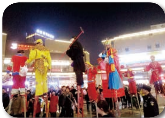
篝火熊熊耀苍穹，欢声笑语满湾田！1月30日晚，一场新年篝火民俗会在新邵湾田广场盛大举行，踩高跷等民俗表演、篝火载歌载舞大狂欢、吃热乎乎的免费糍粑、一条龙置办年货……湾田广场，唤醒记忆中的年味！