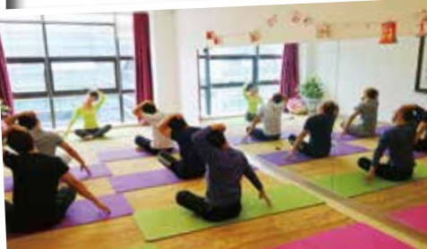
10月31日，湾田同趣小组、湾田瑜伽协会男士瑜伽班正式开班。