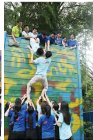
7月8日，湾田商学院金子种子集训营现场，第三届金子种子入列湾田人才梯队。目前，金子们都已转正，在岗位上发光发热。