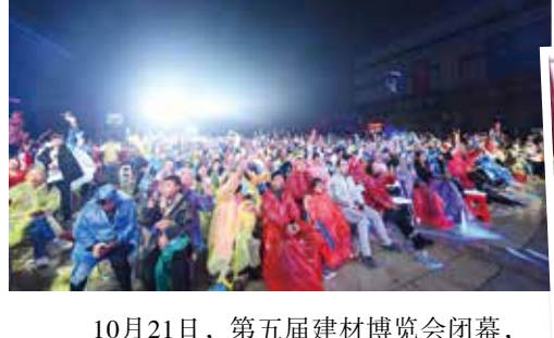
10月21日，第五届建材博览会闭幕，“湖南首届抖神音乐会”现场。让建材嗨起来，以更年轻、更时尚、更创新、更开放的思维办展，引领潮流。