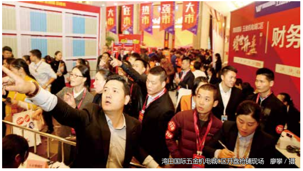
湾田国际五金机电城C区开盘抢铺现场 来和信心。五金C开盘，是一次倾情献礼，但也吹响了湖南五金机电行业整合升级的响亮号角。做霸主，执牛耳，从此五金江湖无战事。（邓艳）

来，湾田国际从商户生意出发，专注运营，组建了湖南唯一一支专业的五金机电运营团队，以强大的B、C端运营能力、丰富的线上线下推广和拓客渠道，一站式供应链的集成服务模式，为商户建立了一个能够永久经营、抱团进步、渠道最优、成本最低、效率最高、服务最优的市场。 新推出的五金机电城C区，更是全面提升交通布局、仓储能力、供应链平台，搭配全新商业及公寓等专属配套生活区，铺铺临街，360度无死角，吃喝玩乐住配套齐全……所有的产品属性，都与湾田国际打造“中国首个建材家居产业小镇”的战略规划相匹配。 战略引领发展，也给了商户以未