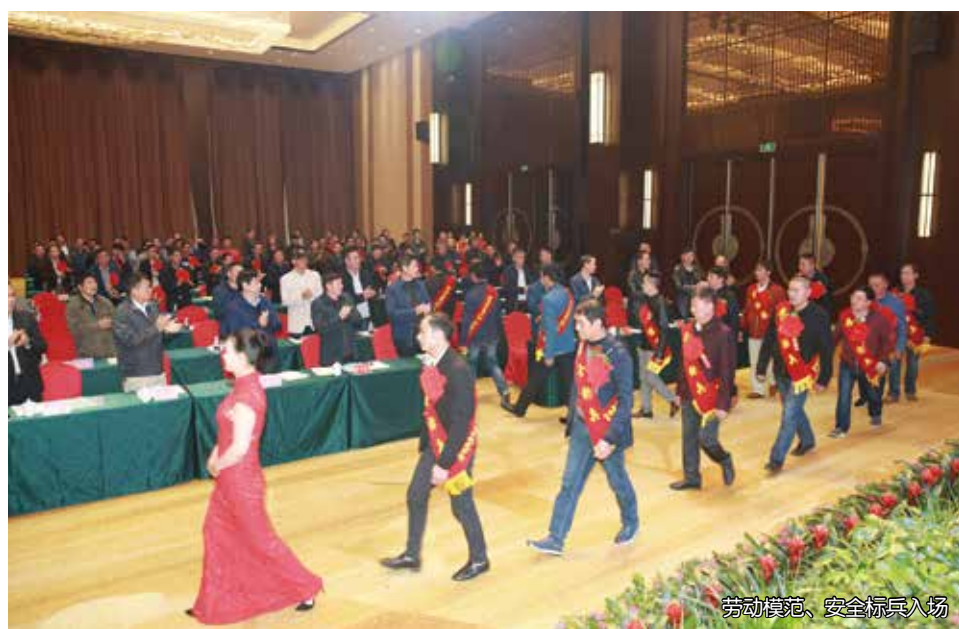
劳动模范、安全标兵入场

2003年开始的湾田之路，是在西部大开发国家战略引领下，实现的湾田创业创富传奇。深耕西南的15年里，湾田紧跟时代步伐，顺势顺势地开启了一次次新的征程，应对时代赋予的新的机遇和挑战，并取得了成功。