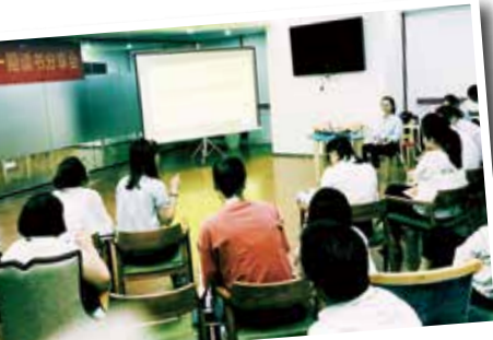
9月14日，湾田同趣小组、湾田国际“八小时书屋”读书分享会现场。读书，成长同行。