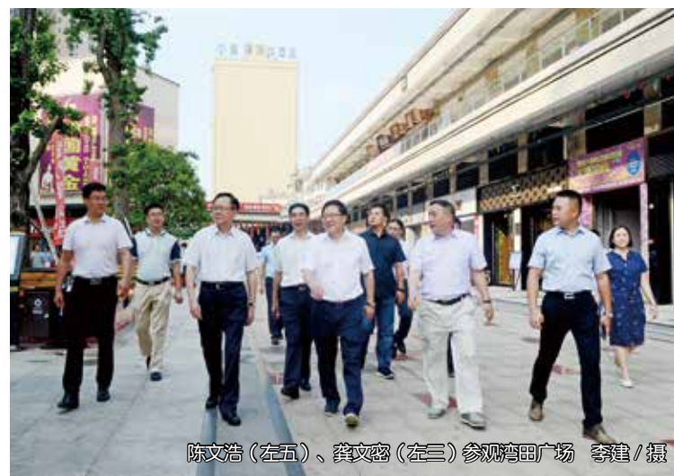
陈文浩(左五)、龚文密(左三)参观湾田广场

陈文浩对湾田广场的规划布局、开发建设、创新运营等给予了高度评价，他指出，湾田广场的棚改实践，是经验积累，也是成果输出，是全省县域城市商业综合体的标杆示范，是县城棚户区