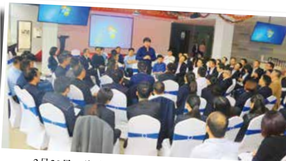
3月30日，湖南湾田集团中高管班第一堂课。为不断提升中高层系统管理水平，培养优秀管理人才，储备业务水平过硬、综合素质一流的高层管理人员，湾田商学院开设中高管班。