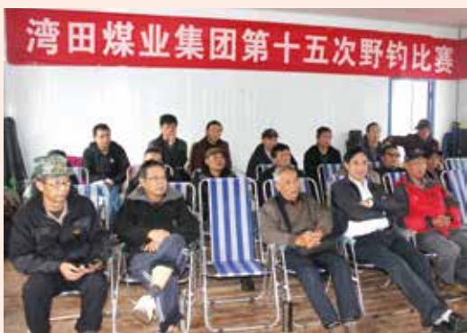
湾田煤业集团第十五次野钓比赛