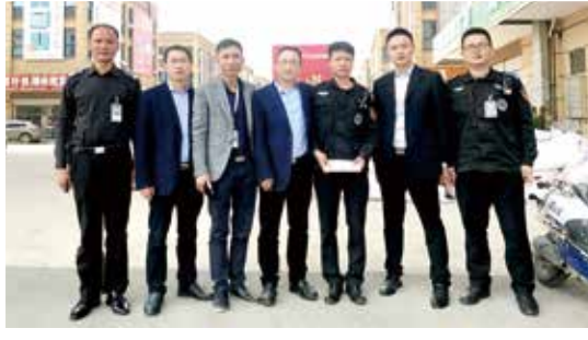
3月26日，湾田·爱心家基金会帮扶困难员工。基金会成立以来，湖南湾田300余名员工加入，2018年累计捐款超400万元。爱心筑家，温暖你我，湾田人在一起。